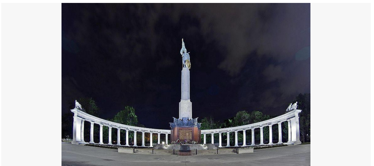
Памятник солдатам Красной Армии в Вене.

- В ознаменование этой победы 50 боевых соединениям, отличившихся в сражении за Вену, получили почётное наименование "Венские". Кроме того, советское правительство учредило медаль «За взятие Вены», которой были награждены все участники боев за столицу Австрии. В Вене в августе 1945 года на площади Шварценбергплац в честь советских воинов, погибших в боях за освобождение Австрии, был установлен памятник.